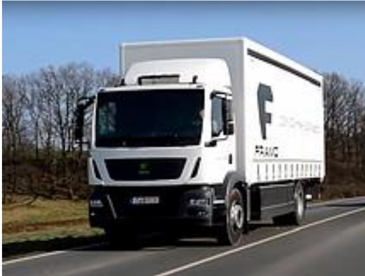
FRAMO eLKW, ausgerüstet mit CuroControl®SRx

Das mobile Steuerungs-/Regelungsgerät für Serien-Anwendungen in der Elektromobilität.